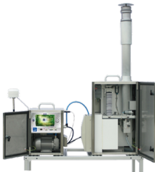
* 若图片与实物不符，则以实物为准