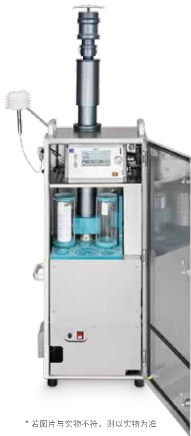
* 若图片与实物不符，则以实物为准