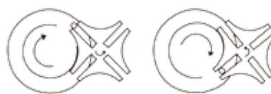
马耳他十字机芯传动机理

全新滤膜同步更换技术 (专利号:2015110108375) 使得滤膜转换的路径更短, 单电机驱动, 使故障率降到最低, 确保30万次换膜连续无故障运行。