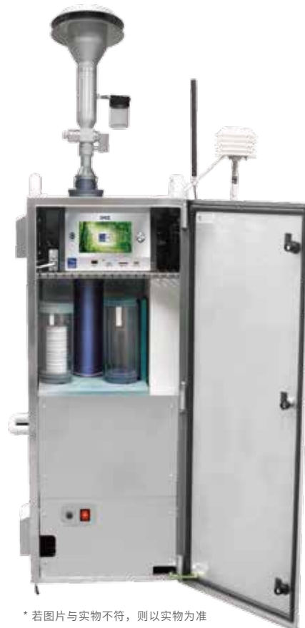
* 若图片与实物不符，则以实物为准