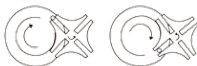
马耳他十字机芯传动机理

全新滤膜同步更换技术(专利号: 2015110108375)使得滤膜转换的路径更短, 单电机驱动, 使故障率降到最低, 确保30万次换膜连续无故障运行。